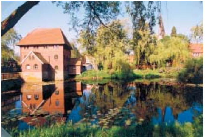
Blick auf die ehemalige fürstliche Wassermühle und den Mühlenkolk.

Hauptverkehrsadern sind heute die Bahnstrecke Hannover - Osnabrück - Amsterdam und die parallel verlaufende Autobahn A 30. Die Lage der Anschlussstelle Schüttorf am Rande des über 135 ha großen stadt eigenen Industriegebietes sowie die Kreuzung